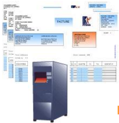
IBM System i